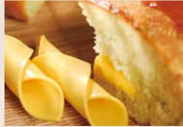
24/ 德島海苔哈斯 NT$110 (奶蛋素)