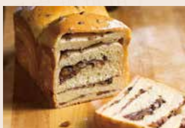
05/ 松子紅豆吐司 NT$200 (奶蛋素)