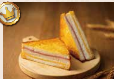
41/ 起士三明治 NT$60 (葷食)