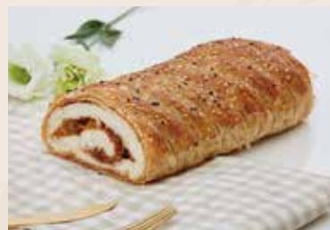
(週四限定) 40/ 經典麵包 🐷 NT$190 (葷食)