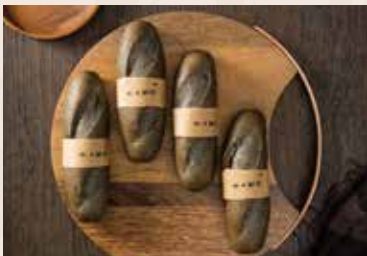
21/ 芝麻軟法 NT$75 (奶蛋素)