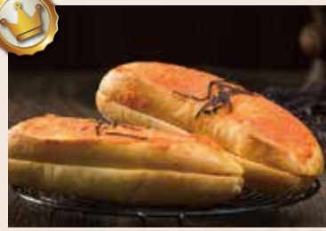
22/ 明太子法國 NT$95 (葷食)