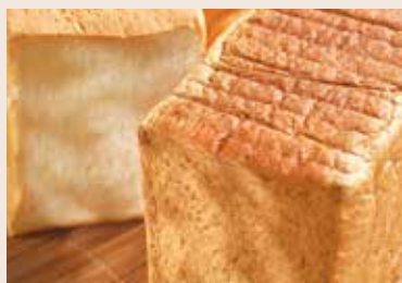
01/ 白吐司 NT$150 (奶素)