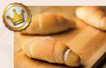
12/ 鹽之花奶油捲 NT$120(3入) (奶蛋素)