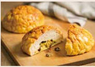
15/ 巨蛋波羅 NT$130 (奶蛋素)