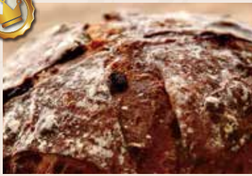
30/ 酒香桂圓 NT$230 (葷食含酒)