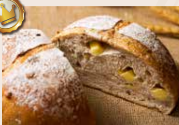
35/ 芭蕾堅果 NT$260 (奶蛋素)