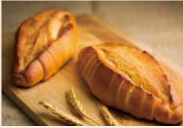
16/ 鹽味香頌 NT$130 (奶蛋素)