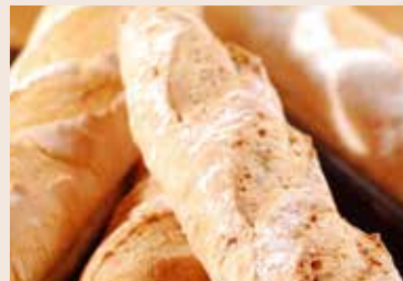
27/ 核桃法國麵包 NT$160 (全素)