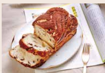
06/ 巧克力大理石 NT$170 (奶蛋素)