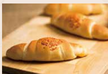
13/ 起司奶油捲 NT$140(3入) (奶素)