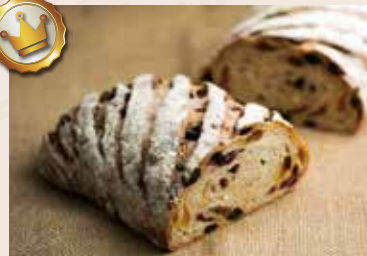
28/ 水果多重奏 NT$210 (奶素)