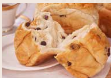
03/ 葡萄吐司 NT$140 (奶蛋素)