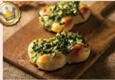
39/ 三星蔥麵包 NT$70(2入) (植物五辛素)