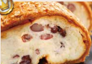
18/ 起酥紅豆麵包 NT$190 (奶蛋素)