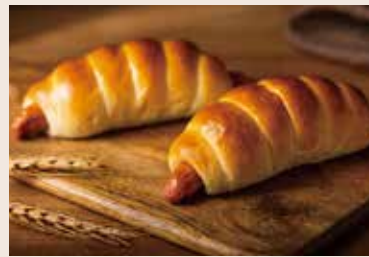
38/ 德式香腸捲 🐷 NT$70 (葷食)