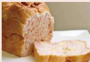
(週一、三、五、日不供應) 09/ 紅麴胚芽起士 NT$190 (奶素)