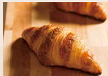
25/ 牛角麵包 NT$75 (奶蛋素)