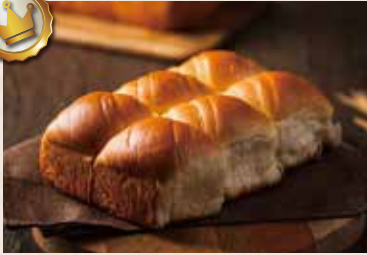
17/ 手撕麵包 NT$180(6入) (奶蛋素)