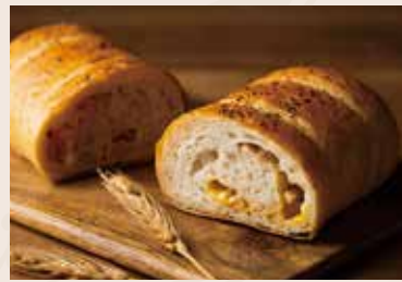
36/ 雙起司燻雞堡 NT$180 (葷食)