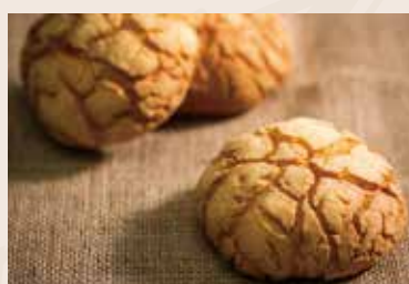
14/ 日式波羅 NT$135(3入) (奶蛋素)