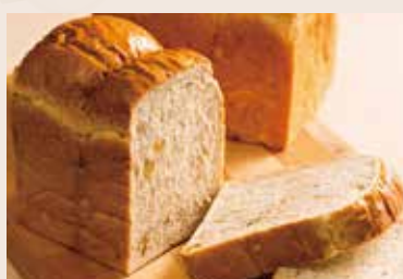
07/ 玄米吐司 NT$180 (奶素)