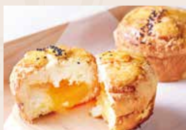
11/ 奶黃麻糬 NT$65 (奶蛋素-鴨蛋黃)