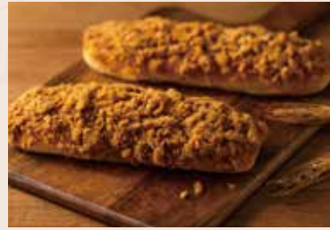
37/ 肉鬆麵包 🐷 NT$60 (葷食)