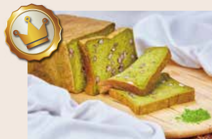
(週一、日不供應) 08/ 抹茶生角食 NT$300 (奶素)