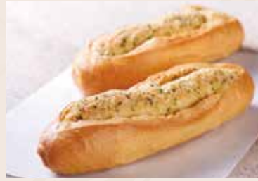
23/ 蒜香法國 NT$80 (葷食)