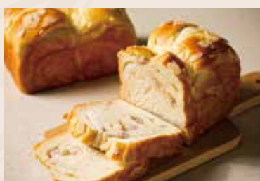
04/ 芋頭吐司 NT$150 (奶蛋素)