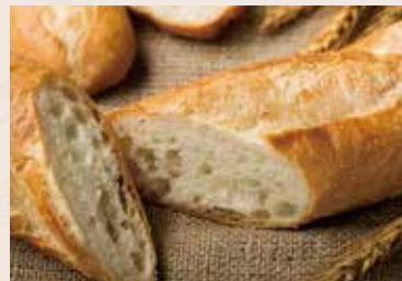
26/ 法國麵包 NT$110 (全素)