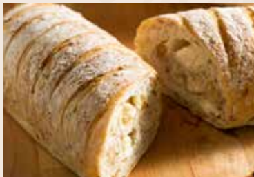
32 亞麻子乳酪 NT$220 (奶蛋素)