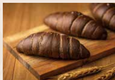
42/ 巧克力鹽之花 NT$120 (奶素)