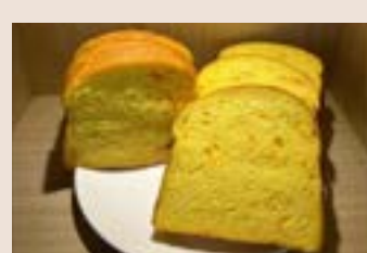
胡蘿蔔吐司 (蛋奶素)