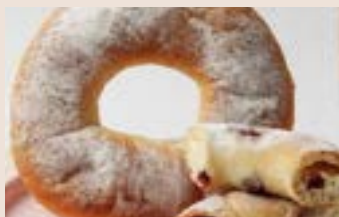
蔓越莓乳酪 (奶素含酒) NT$75