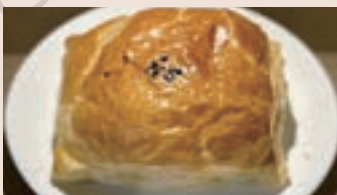
肉鬆酥皮 (葷食/含堅果)