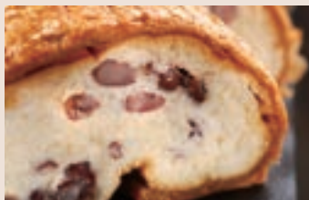
👑 起酥紅豆 (蛋奶素/含堅果) NT$200