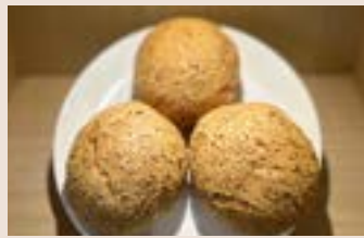
韓國麵包 (蛋奶素/含堅果) NT$65