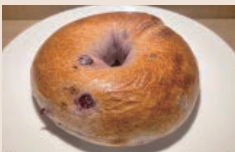
藍莓貝果 (奶素) NT$60