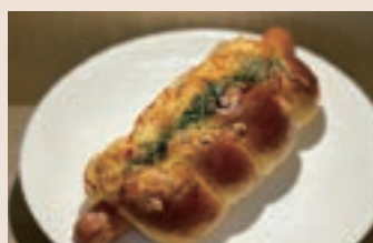
德式香腸捲 (葷食) NT$55