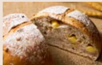
芭蕾堅果 (蛋奶素/含堅果) NT$280 ★週三限定版