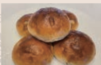
葡萄餐包 (蛋奶素含酒) NT$85