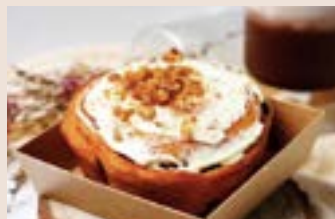
👑 肉桂卷 (蛋奶素含酒/含堅果) NT$85