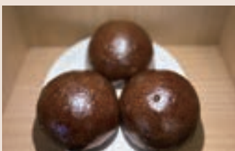
軟歐可可豆 (蛋奶素) NT$75