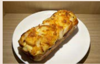
起司火腿洋蔥 (蛋奶素) NT$65