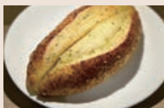
香蒜起司 (葷食) NT$65