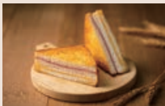
👑 起士三明治 (葷食) NT$65