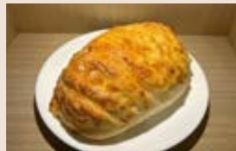
軟歐起司 (蛋奶素) NT$75