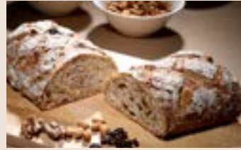
裸麥高纖 (奶素含酒/含堅果) NT$220 ★週三限定版