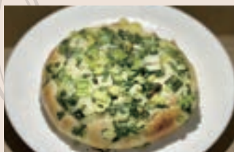
👑 青蔥麵包 (植物五辛素) NT$60