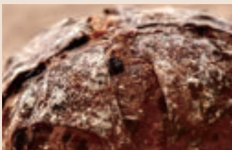
👑酒香桂圓 (全素含酒/含堅果) NT$240