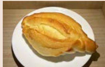
海鹽羅宋 (蛋奶素) NT$63