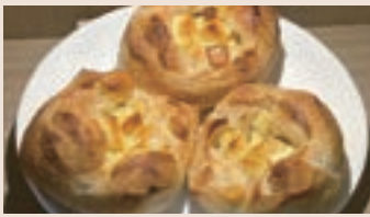
法式起司餐包 (蛋奶素)