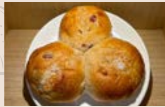
蜂蜜麻糬 (蛋奶素) NT$75