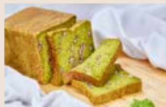
抹茶生角食 (奶素) NT$300 ★週三限定版