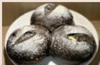
草莓可可 (奶素含酒) NT$75