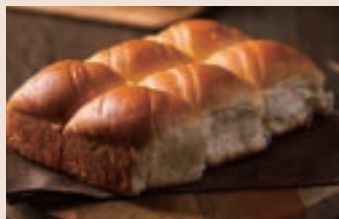
👑 手撕麵包 (蛋奶素) NT$200(6入)