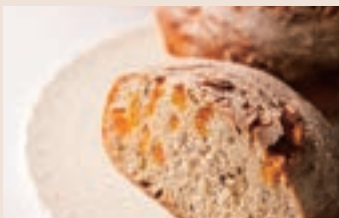
樂活地瓜 (全素/含堅果) NT$180