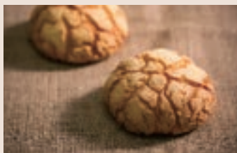
日式波羅 (蛋奶素) NT$45