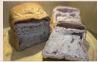
藍莓乳酪吐司(小) (蛋奶素)