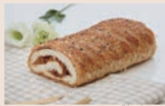
經典麵包 (葷食/含堅果) NT$200 ★週三限定版