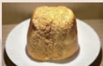
古早味花生夾心 (蛋奶素/含堅果) NT$50