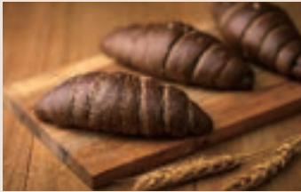
巧克力鹽之花 (奶素/含堅果) NT$130