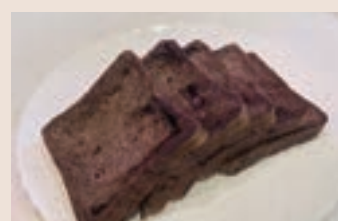
生巧克力吐司 (奶素)