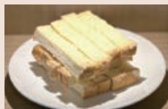
香酥烤吐司 (蛋奶素)