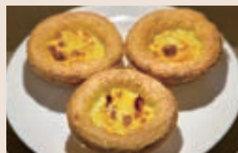
葡式起酥蛋塔 (蛋奶素)