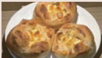
法式起司餐包 (蛋奶素)