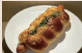
德式香腸捲 (葷食) NT$55