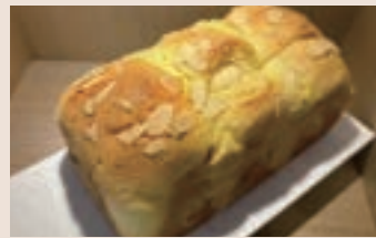
巴布羅吐司 (蛋奶素/含堅果)