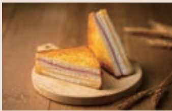
👑 起士三明治 (葷食) NT$60