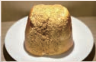
古早味花生夾心 (蛋奶素/含堅果) NT$45