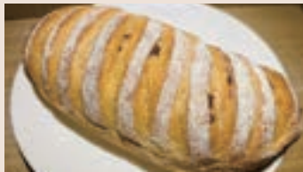
莓好找橙 (奶素含酒)