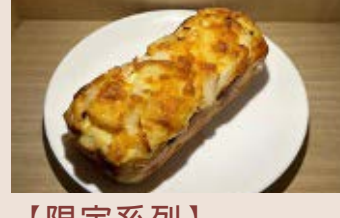
起司火腿洋蔥 (蛋奶素)