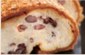
👑 起酥紅豆 (蛋奶素/含堅果) NT$190