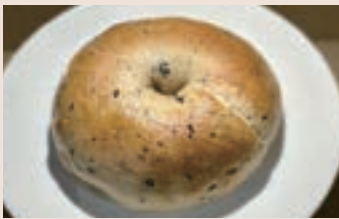
伯爵芒果貝果 (蛋奶素)