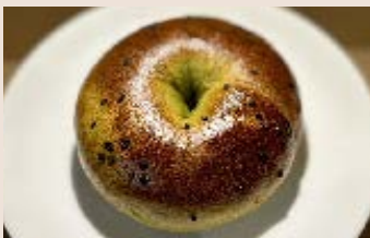
抹茶柑橘貝果 (蛋奶含酒)