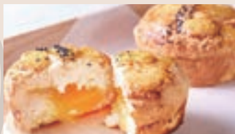
奶皇麻糬菠蘿 (蛋奶素/含堅果)