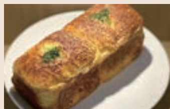
德腸馬鈴薯 (葷食) NT$65