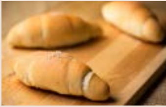
鹽之花奶油捲 (奶素)