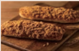
肉鬆麵包 (葷食) NT$50