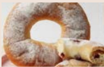
蔓越莓乳酪 (奶素含酒)