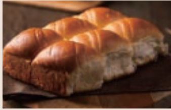
👑 手撕麵包 (蛋奶素) NT$180(6入)