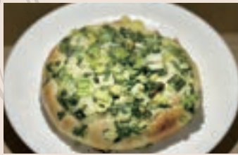
👑 三星蔥麵包 (植物五辛素) NT$60