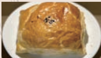
肉鬆酥皮 (葷食/含堅果)