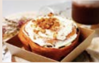
👑 肉桂卷 (蛋奶素含酒/含堅果) NT$85