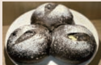
草莓可可 (奶素含酒) NT$70