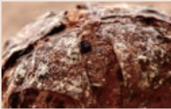
酒香桂圓 (全素含酒/含堅果)