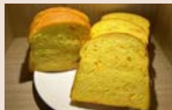
胡蘿蔔吐司 (蛋奶素)