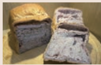
藍莓乳酪吐司(小) (蛋奶素)