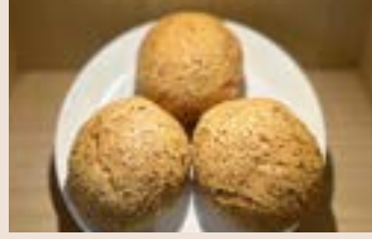
韓國麵包 (蛋奶素/含堅果) NT$60