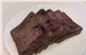
生巧克力吐司 (奶素)