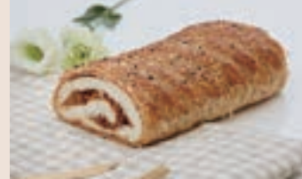
經典麵包 (葷食/含堅果)