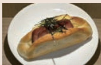
厚切燒肉 (葷食) NT$60