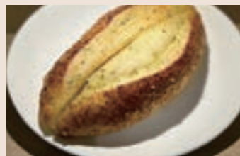
香蒜起司 (葷食) NT$65