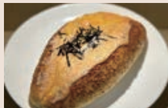
明太子起司 (葷食) NT$70