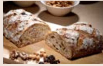
裸麥高纖 (奶素含酒/含堅果)