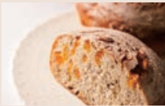
樂活地瓜 (全素/含堅果)