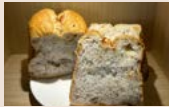
堅果吐司 (奶素/含堅果)