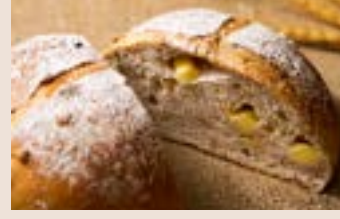
芭蕾堅果 (蛋奶素/含堅果)