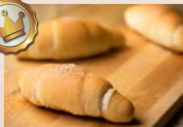
12/ 鹽之花奶油捲 NT$125(3入) (奶蛋素)