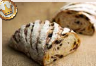
28/ 水果多重奏 NT$220 (奶素)