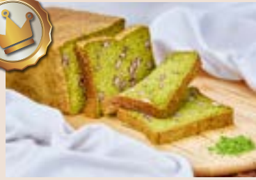
(下午16:00後 供應) (週六、日、一 不供應) 08/ 抹茶生角食 NT$300 (奶素)