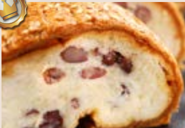
18/ 起酥紅豆麵包 NT$200 (奶蛋素)