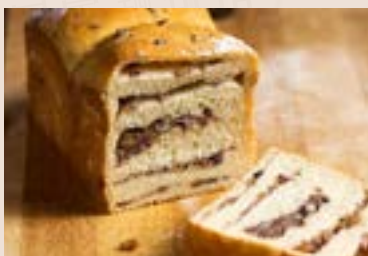
05/ 松子紅豆吐司 NT$210 (奶蛋素)