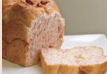
(週二、四 供應) 09/ 紅麴胚芽起士 NT$190 (奶素)