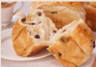
03/ 葡萄吐司 NT$155 (奶蛋素)