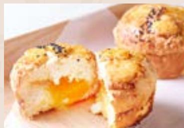
11/ 奶黃麻糬 NT$65 (奶蛋素-鴨蛋黃)