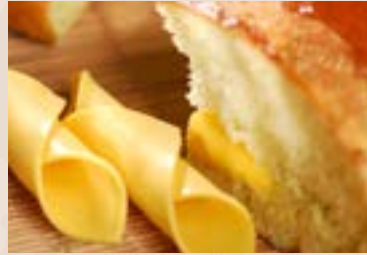
24/ 德島海苔哈斯 NT$130 (奶蛋素)