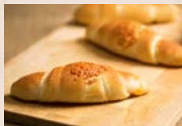
13/ 起司奶油捲 NT$140(3入) (奶素)