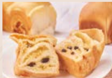
10/ 椰香三重奏 NT$160 (奶蛋素)