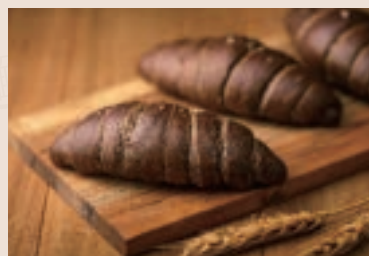
(下午16:00後 供應) 42/ 巧克力鹽之花 NT$130 (奶素)