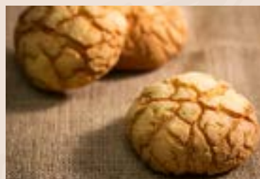
14/ 日式波羅 NT$135(3入) (奶蛋素)