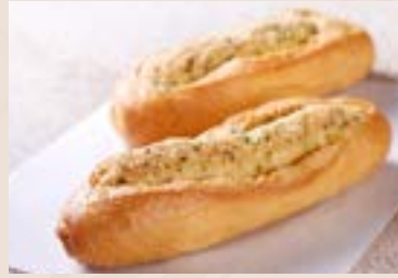
(下午16:00後 供應) 23/ 蒜香法國 NT$80 (葷食)