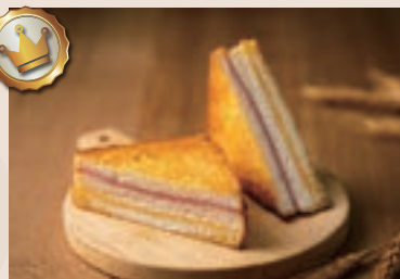
41/ 起士三明治 NT$65 (葷食)