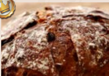
30/ 酒香桂圓 NT$240 (葷食含酒)