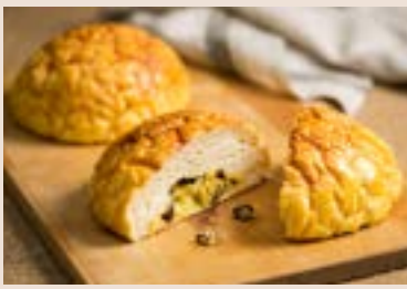
15/ 巨蛋波羅 NT$140 (奶蛋素)