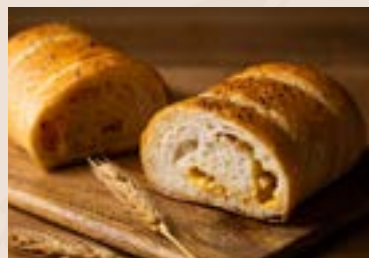
(下午16:00後 供應) (週六、日 不供應) 36/ 雙起司燻雞堡 NT$190 (葷食)