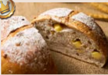
(下午16:00後 供應) 35/ 芭蕾堅果 NT$280 (奶蛋素/含堅果)