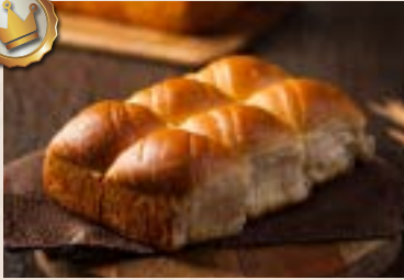
17/ 手撕麵包 NT$200(6入) (奶蛋素)