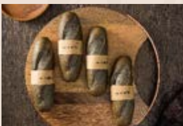
21/ 芝麻軟法 NT$75 (奶蛋素)