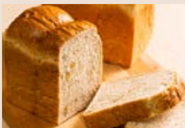
07/ 玄米堅果吐司 NT$190 (奶素/含堅果)