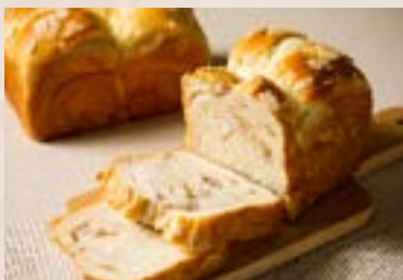
04/ 芋頭吐司 NT$160 (奶蛋素)