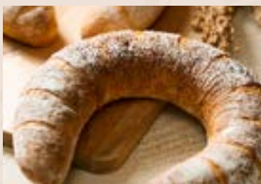
33/ 橙香乳酪 NT$190 (奶素)