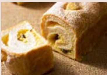
34/ 甜酥香栗 NT$190 (奶蛋素)