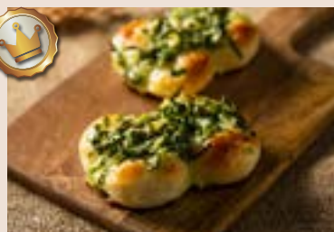
(下午16:00後 供應) 39/ 青蔥麵包 NT$70(2入) (植物五辛素)