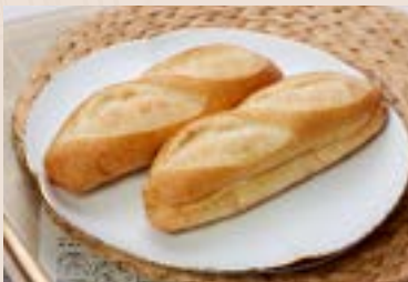
20/ 維也納 NT$75 (奶素)