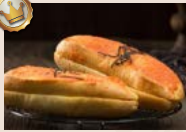
(下午16:00後 供應) 22/ 明太子法國 NT$95 (葷食)