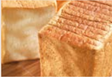
(下午16:00後 供應) 02/ 全麥吐司 NT$170 (奶素)