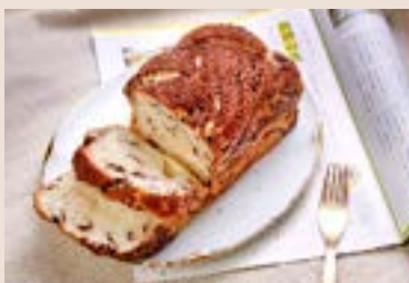
06/ 巧克力大理石 NT$170 (奶蛋素)