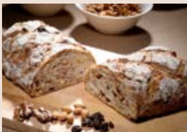
29/ 裸麥高纖 NT$220 (奶蛋素/含堅果)