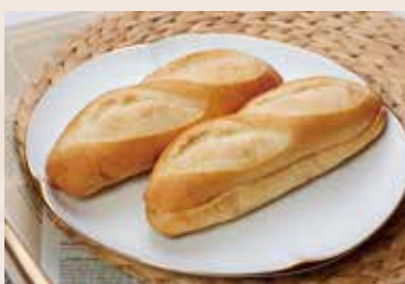
19/ 維也納 NT$75 (奶素)