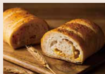
(週六、日不供應) 38/ 雙起司燻雞堡 NT$180 (葷食)