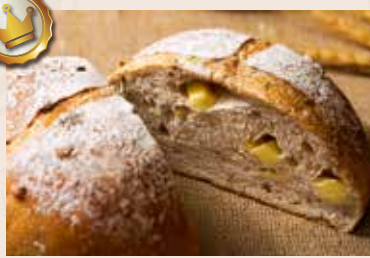
26/ 芭蕾堅果 NT$260 (奶蛋素)