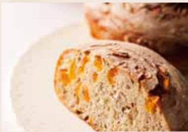
(每週不定時供應) 34/ 樂活地瓜 NT$170 (全素)