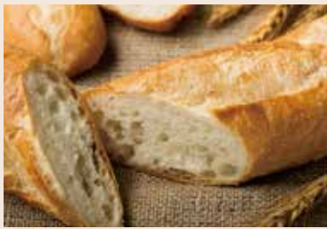
(每週不定時供應) 29/ 法國麵包 NT$110 (全素)