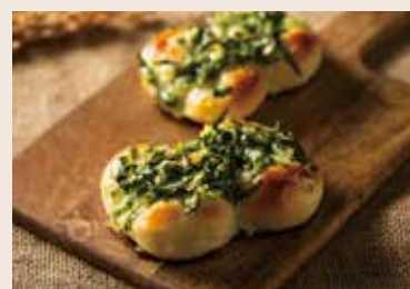
39/ 三星蔥麵包 NT$70(2入) (植物五辛素)