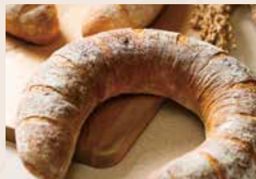
(每週不定時供應) 36/ 橙香乳酪 NT$180 (奶素)