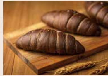
42/ 巧克力鹽之花 NT$120 (奶素)