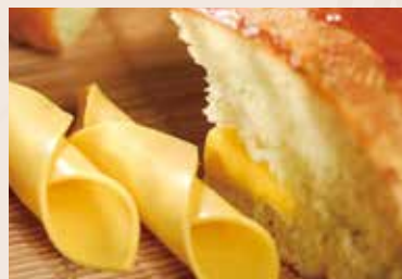
23/ 德島海苔哈斯 NT$110 (奶蛋素)