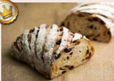
(每週不定時供應) 31/ 水果多重奏 NT$210 (奶素)