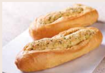
22/ 蒜香法國 NT$80 (葷食)