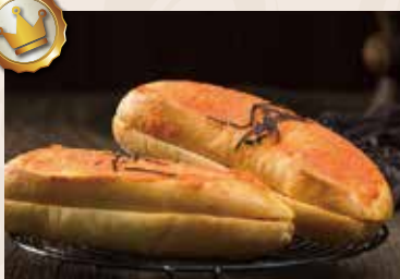
21/ 明太子法國 NT$95 (葷食)