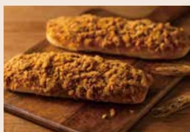
27/ 肉鬆麵包 🐷 NT$60 (葷食)