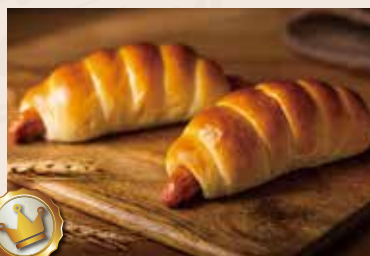
28/ 德式香腸捲 🐷 NT$70 (葷食)