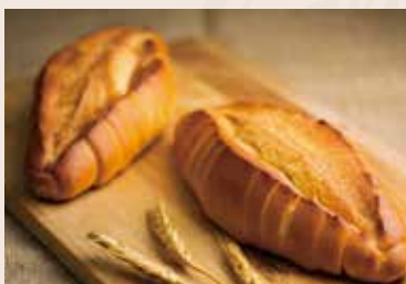
16/ 鹽味香頰 NT$130 (奶蛋素)