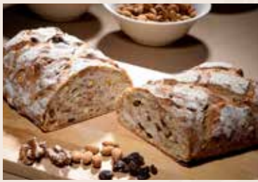
(每週不定時供應) 32/ 裸麥高纖 NT$200 (奶蛋素)