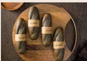
20/ 芝麻軟法 NT$75 (奶蛋素)