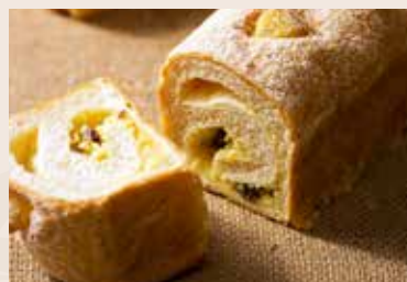
25/ 甜酥香栗 NT$180 (奶蛋素)