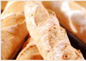
(每週不定時供應) 30/ 核桃法國麵包 NT$160 (全素)