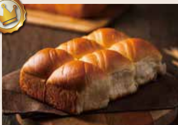
17/ 手撕麵包 NT$180(6入) (奶蛋素)