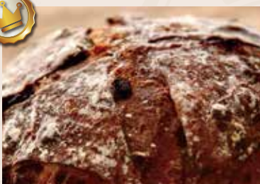
(每週不定時供應) 33/ 酒香桂圓 NT$230 (葷食含酒)