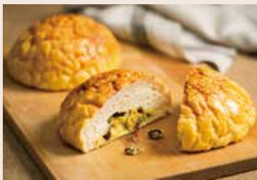
15/ 巨蛋波羅 NT$130 (奶蛋素)